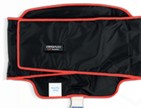
• ESPALDA •