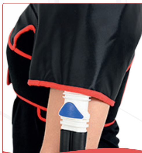
LISTO PARA USAR