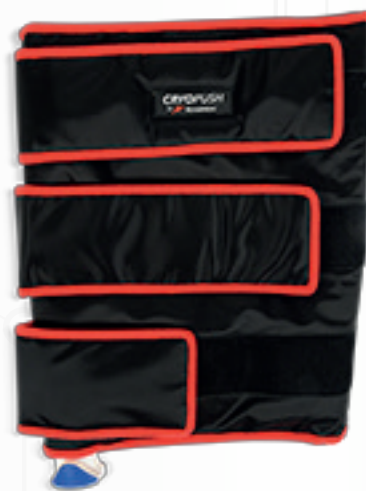
• RODILLA •