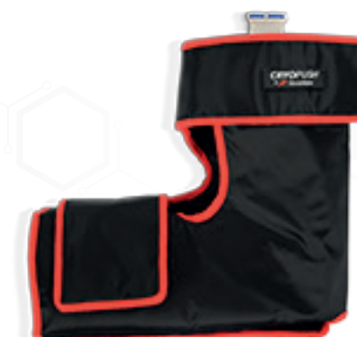
• TOBILLO •