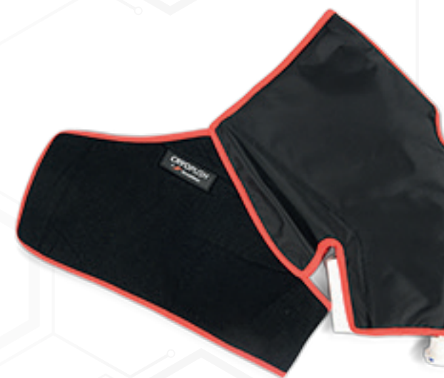
• HOMBRO •